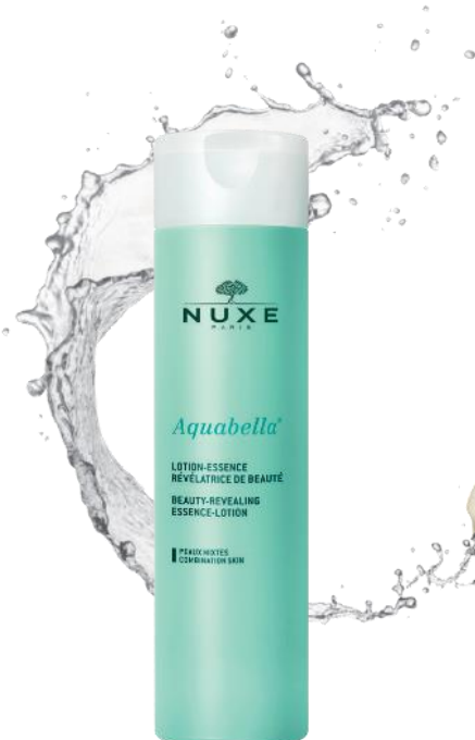
Aquabella® Upiększający Tonik- Esencja