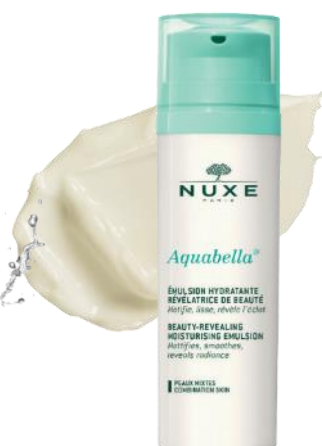
Aquabella® Upiększająca Emulsja Nawilżająca