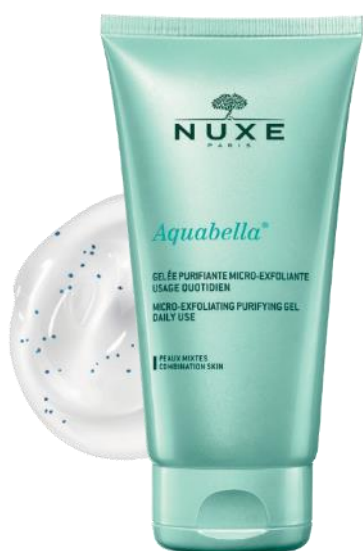
Aquabella® Mikro - złuszczający peeling do twarzy