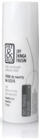
KREM DO TWARZY NA DZIEŃ CENA: 140 ZŁ POJEMNOŚĆ: 50 ML