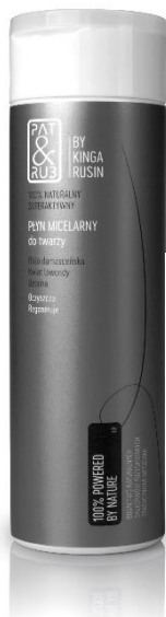
PŁYN MICELARNY CENA: 60 ZŁ POJEMNOŚĆ: 200 ML