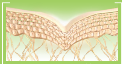
PRZED KURACJĄ (2)

OLEJ Z MIKROALG WYKAZUJE DZIAŁANIE NA DWA GŁÓWNE KOMPONENTY, KTÓRE PRZYCZYNIAJĄ SIĘ DO UTRZYMANIA MŁODOŚCI SKÓRY, W OBSZARZE DEJ (1) : WZROST SYNTEZY KOLAGENU 4 (ADHEZJA WŁÓKIEŃ) (X 2,5) ORAZ ZWIĘKSZENIE ILOŚCI BIAŁKA LAMININY 5 (X 3.4).