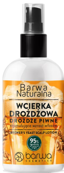
Wcierka Drożdżowa Barwa Naturalna, 15 zł/100 ml

Drożdże piwne – główny składnik Wcierki Drożdżowej Barwa Naturalna - to tradycyjny, przetestowany przez pokolenia kobiet, sposób na wypadające i osłabione włosy. Mają pozytywny wpływ na każdy rodzaj włosów – zarówno tych przetłuszczających się, jak i przesuszonych. Kluczowe dla włosów substancje zawarte w drożdżach piwnych to: