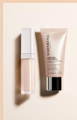
FLAWLESS COMPLEXION Makeup