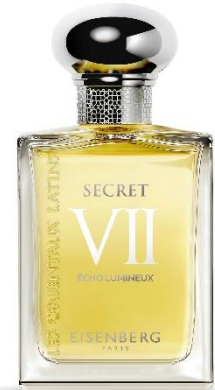
EISENBERG Paris Secret VII Écho Lumineux