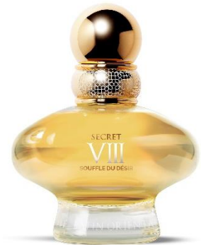
EISENBERG Paris Secret VIII Souffle du Désir