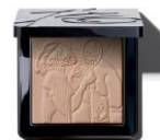
J.E. DIVINE 7 g 2 SKUs