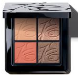
J.E. COLOUR CODE® 8,5 g 4 SKUs