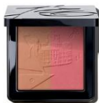
J.E. SUNLIT BLISS Sun Powder 12 g 4 SKUs